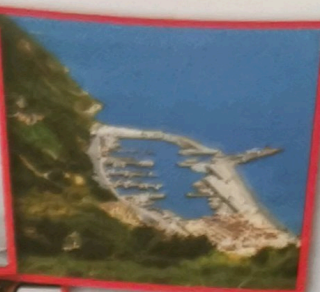
BAIA DEGLI ANGELI